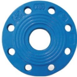
Plaque de réduction